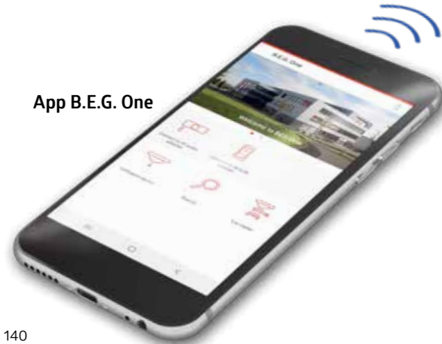
App B.E.G. One