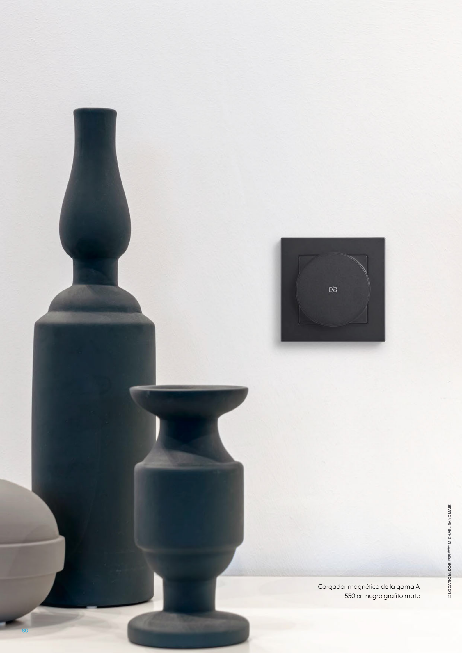
Cargador magnético de la gama A 550 en negro grafito mate