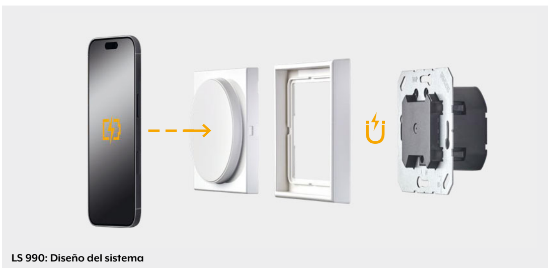
LS 990: Diseño del sistema