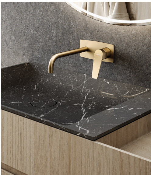
Monomando de lavabo empotrado en acabado Gold

Los monomandos de lavabo empotrados de esta nueva serie exclusiva de Genebre también cuentan con un aireador economizador antivandálico de 5l/m.