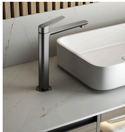
Acabado Brushed metal