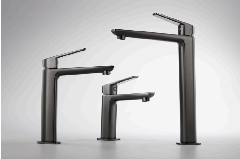
Los monomandos de la Serie Kloe están disponibles en 3 alturas diferentes

Los monomandos de lavabo de la nueva Serie KLOE están disponibles en tres alturas (159, 218 y 299 mm.) para adaptarse a todos los gustos y necesidades y cuentan con un aireador economizador antivandálico de 5l/m.